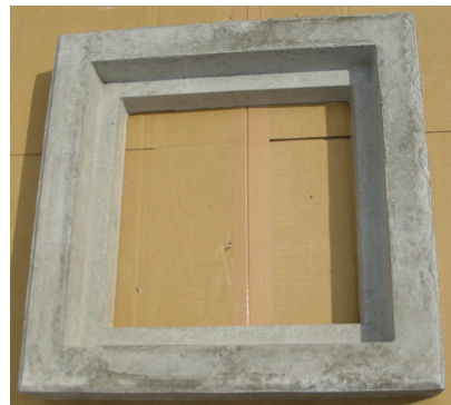
仕様寸法表 (単位 mm)