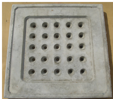
仕様寸法表 (単位 mm)